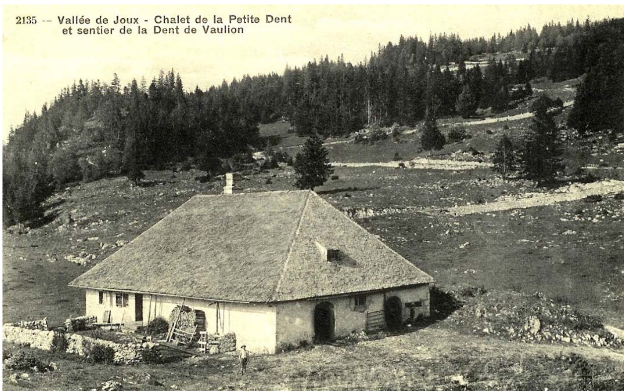
Chalet et alpage de la Petite-Dent dessous, propriété du village du Pont.

Vaulion est connu dans notre pays, grâce à la sommité qui porte son nom et qui est située sur son territoire, la Dent de Vaulion. De cette localité, l'ascension en est très facile et sans aucun danger. En une heure et demie, on atteint le sommet sans aucune difficulté. Au lieu de gravir d'étroits et rapides sentiers, comme c'est, en général, le cas quand on fait l'ascension d'une sommité, les promeneurs traversent pendant trois quarts d'heure, des campagnes cultivées, puis le pâturage, puis enfin une forêt de hêtres dont les arbres, à mesure qu'on approche du sommet, se rabougrissent, non pas à cause de l'altitude, mais à cause de l'exposition et du manque de terre. A part ces sentiers, un beau chemin carrossable, dessinant quelques lacets, conduit de Vaulion au chalet de la Dent.